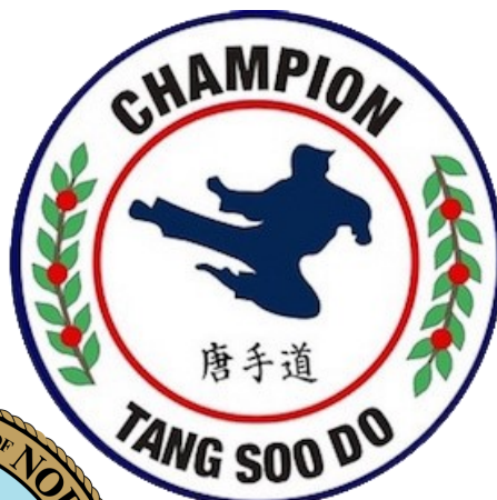
セスさんは全米大会で優勝した経験が2回あるそうです。